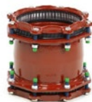
GF Multi Joint Reparaturkupplungen