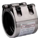
Reparatur- und Montagekupplungen